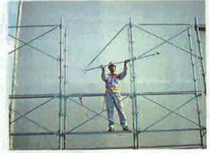
③斜材を持ち、反対側の支柱緊結部に固定くさびを差し込みます