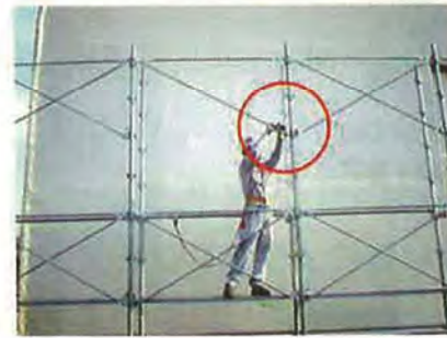
⑤下部くさびを支柱緊結部に固定します。 (ハンマーによる打ち込み 1回)