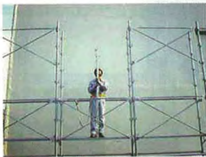
①施工の準備をします