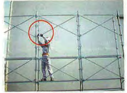
⑥もう一方の下部くさびも支柱緊結部に固定します。 (ハンマーによる打ち込み 1回)