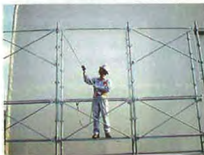
④支柱緊結部に固定くさびを差し込みます。 (ハンマーによる打ち込みは不要)